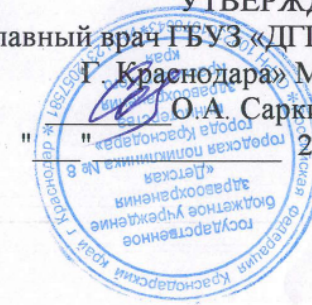
График работы медицинского кабинета на базе помещений МБДОУ МО г. Краснодар «Детский сад № 109»